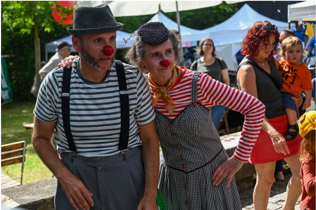
Clownprojekt Clown.Spiel.Raum:Langwasser! 2024. Die Clowntruppe improvisiert mitten im Sommerfest vom Gemeinschaftshaus Langwasser.