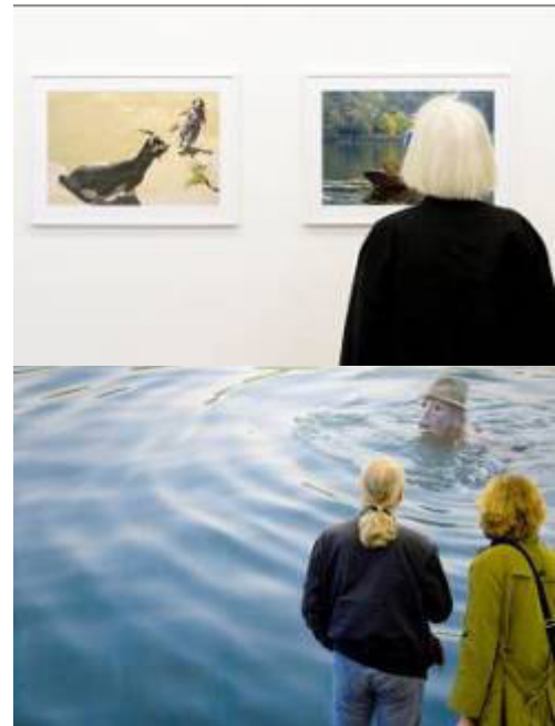
Ausstellung im Zumikon Nürnberg, 2016 Carl / Weiß

Die Fotografien können in limitierter Auflage bei mir erworben werden. Seit diesem Jahr vertritt die Galerie Kunstkontor in Nürnberg www.kunstkontor-nuernberg.de meine fotografische Arbeit.